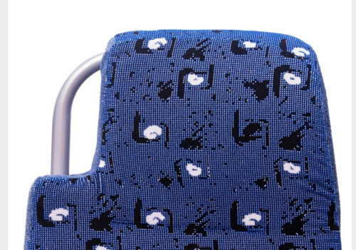
Asidero metálico/ Metal side handle