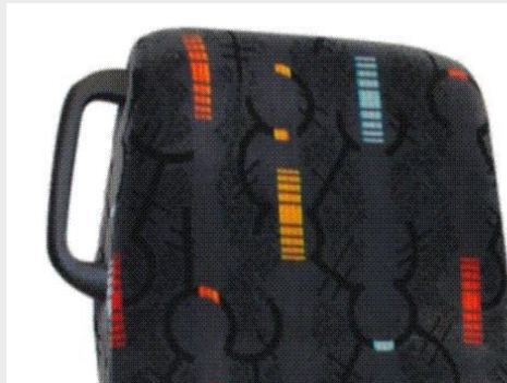
Asidero lateral de plástico/ Plastic side handle