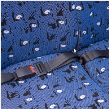
Cinturón 2 puntos fijo/ 2-point fixed seat belt