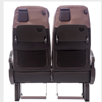
Integración de opcionales/ Integration of optional features