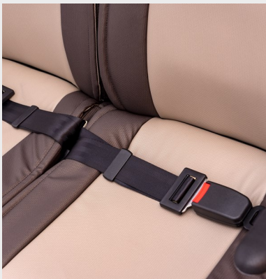
Cinturón de 2 puntos fijo/ 2-point fixed seat belt