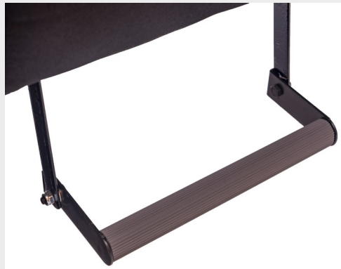
Apoyapiés modelo U2/ U2 model ootrest