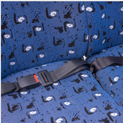
Cinturón de 2 puntos fijo/ 2-point fixed seat belt