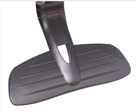
Apoyapiés modelo MT4/ MT4 model footrest