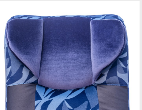
Apoyos faciales en respaldos/ Backrest facial supports