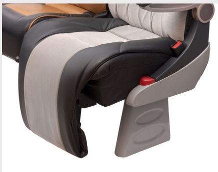
Reposapiernas europeo continuo/ European continuous leg support pad