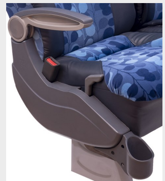
Carcasa lateral en ABS/ ABS side shell