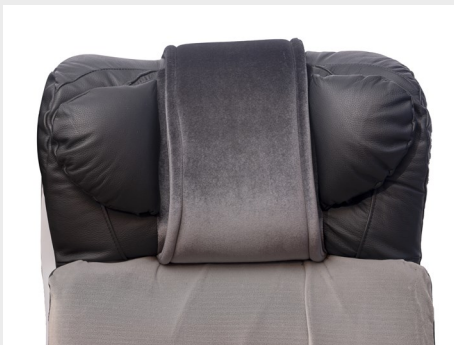
Cabecera en viscolastic/ Memory foam headrest