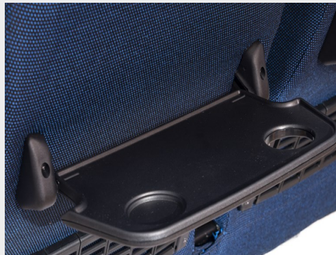
Mesa tipo avión de plástico/ Airplane-type plastic tray