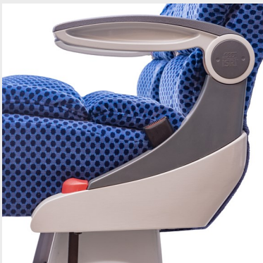
Lateral de aluminio modelo IRATI/ IRATI model aluminum alu side