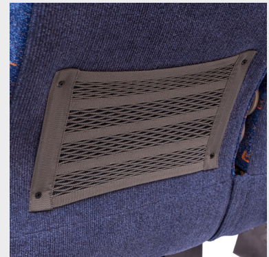
Revistero de malla color gris/ Gray mesh magazine holder