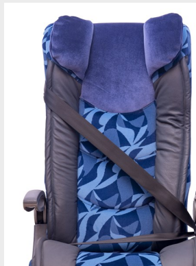
Cinturón retráctil de 3 puntos/ 3 point retractable seat belt