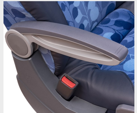
Brazo pasillo elevable modelo IRATI / IRATI model swivel aisle armrest