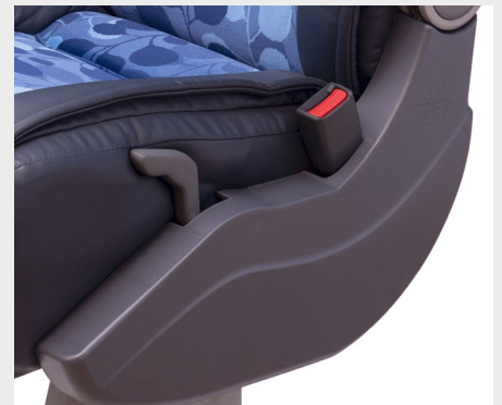
Carcasa lateral en ABS/ ABS side shell