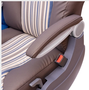
Apoyabrazos tapizado/ Upholstered armrest