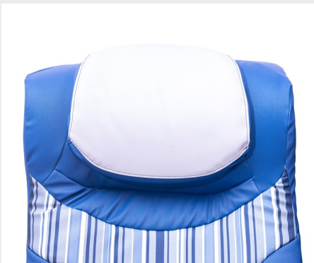
Cabecera acolchada/ Padded headboard