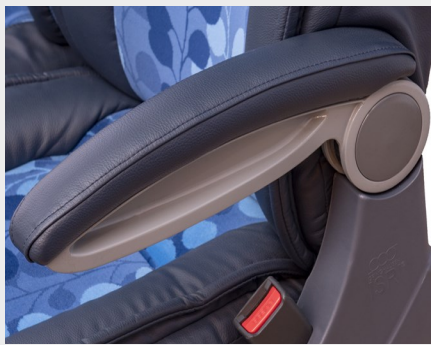
Apoyabrazos tapizado/ Upholstered armrest