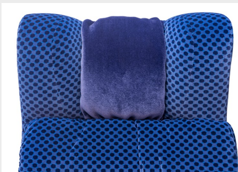
Cabecera en viscolastic/ Memory foam headrest